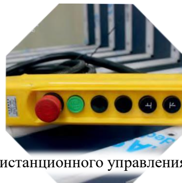
Пульт дистанционного управления